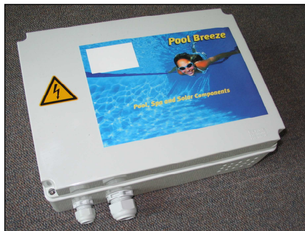
Transfo in kast